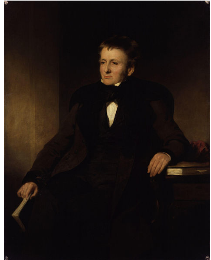
Fig. 15: Thomas de Quincey, Portrait by Sir John Watson-Gordon, National Portrait Gallery, London.

(Thomas de Quincey, “Second Paper on Murder”, 1839)