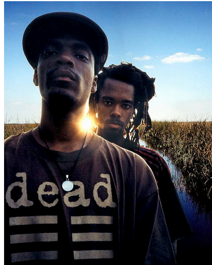
Fig. 12: Dead Prez.