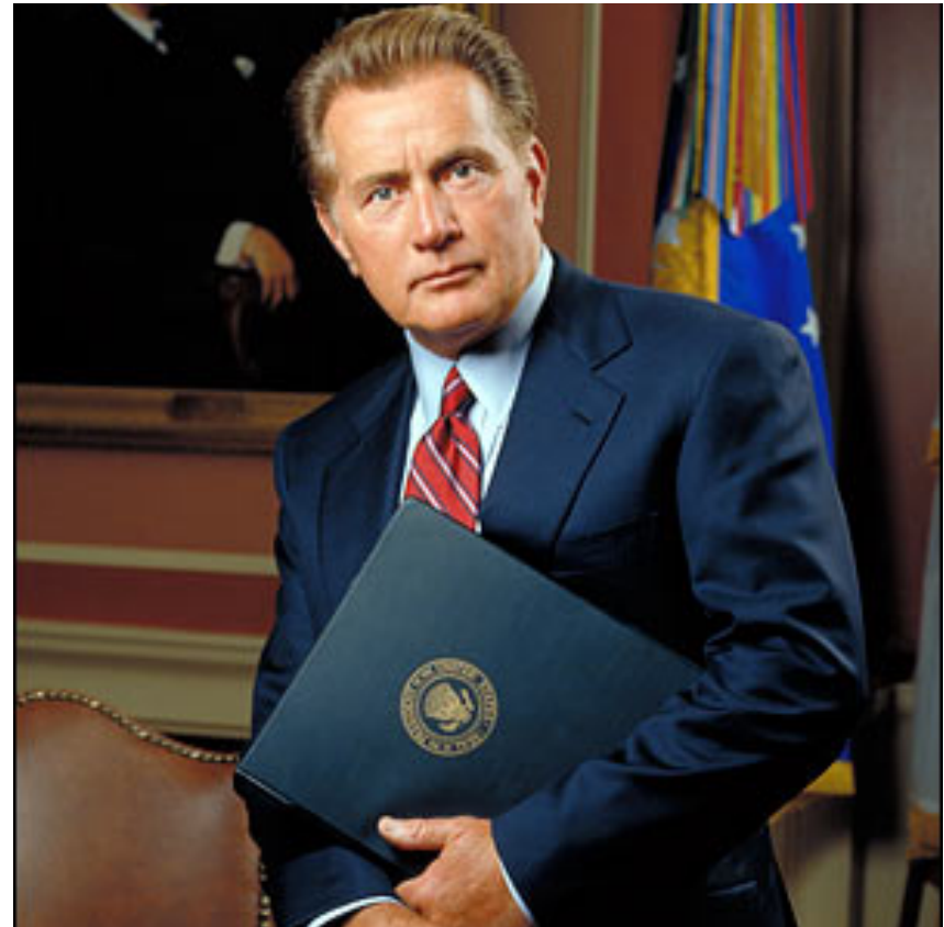
Fig. 16: Josiah Edward "Jed" Bartlet (Martin Sheen, NBC's West Wing)

“After it therefore because of it.” It means one thing follows the other, therefore it was caused by the other. But it's not always true. In fact, it's hardly ever true.