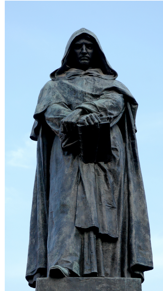
Fig. 13: Bronsstaty av Giordano Bruno, Ettore Ferrari (Campo de' Fiori, Rom)

Dominikanermunken Giordano Bruno (1548-1600) trodde på Kopernikus astronomiska hypoteser men gick ännu längre (han antog att solen var en stjärna bland andra i en oändlig rymd). Kyrkan hotade honom till livet om han inte ändrade sig. Han vägrade acceptera ad baculum -argumentet och brändes på bål år 1600.