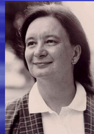
Susan Haack (1945-)