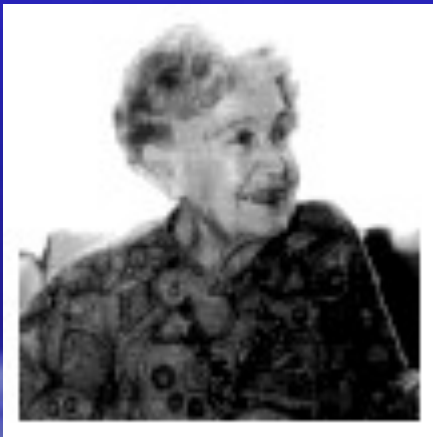
Helena Rasiowa (1917-1994)